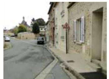
rue de la Vierge