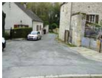
ruelle de la Fontaine bénite