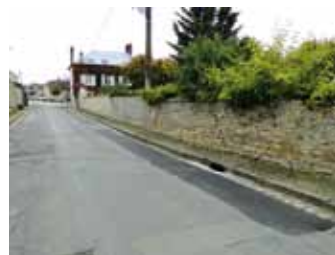
rue Maurice Vauvillier