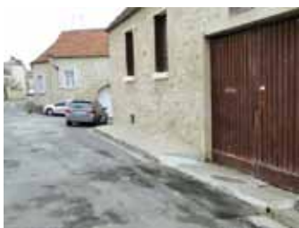
rue de l'Abreuvoir

Lors des gros travaux de remise en état du réseau d'assainissement réalisés tout au long de l'année 2014, une nouvelle voie a été créée au Grand Mesnil. Cette dernière reliera à terme la rue Narcisse Aussenard au Clos des Galets. Par délibération, le conseil l'a baptisée rue Saint-Sulpice en souvenir de l'ancienne carrière du même nom située en amont des dernières maisons du Clos des Galets.